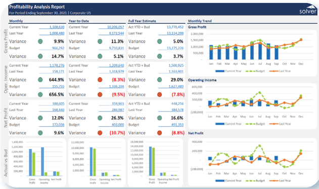
Dashboard de análisis de rentabilidad