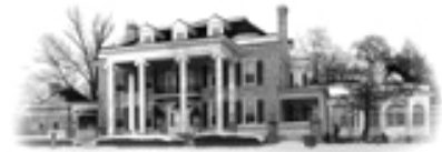
Hershey Trust Company

Hershey Trust Company, fundada en 1905, actúa como fideicomisario del Milton Hershey School Trust, The M.S. Hershey Foundation Trust y el Hershey Cemetery Perpetual Care Trust. Con sede en Hershey, Pensilvania, Hershey Trust Company ofrece servicios de gestión de fideicomisos e inversiones de primer nivel para preservar y avanzar el legado de Milton y Catherine Hershey a perpetuidad.